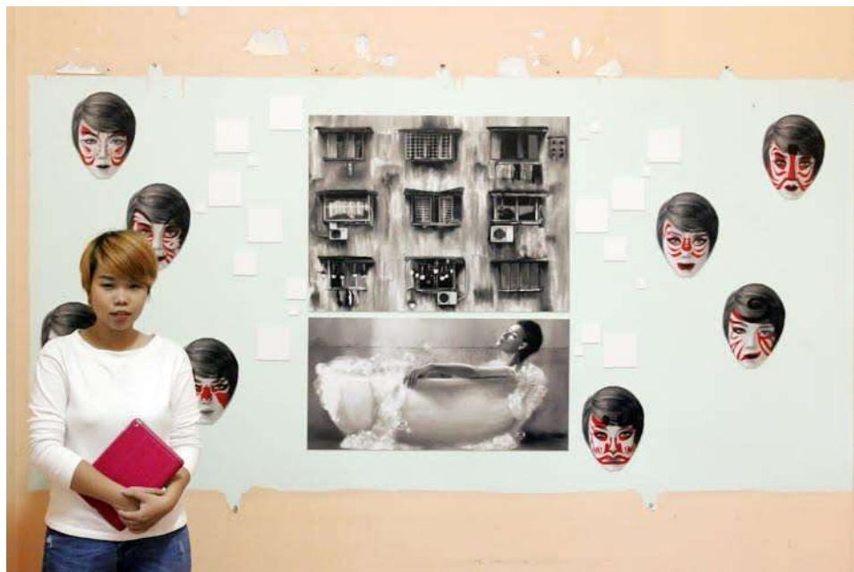
Tác phẩm “chung cư” của tác giả Trần Hải Bình (sinh năm 1991) với ý tưởng trong những toà chung cư cũ nát của thành phố, mỗi căn hộ đều có những câu chuyện khác nhau, phía sau cánh cửa họ mới có thể rũ bỏ được lớp mặt nạ chồng chất... Phải chăng giữa đô thị xô bồ này những người trẻ tuổi ngày càng trở nên vô cảm.