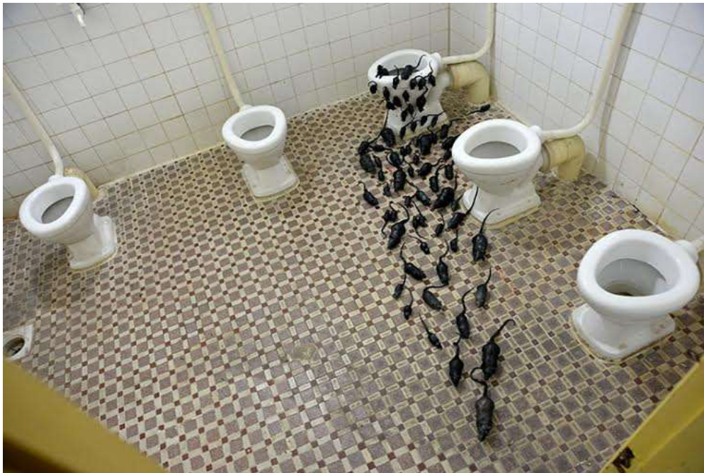
Tác phẩm “Chuột” của tác giả Đỗ Hà Hoài (sinh năm 1994) lấy cảm hứng từ những cư dân chuột sống trong thành phố. Chuột có mặt ở khắp mọi nơi trên thế giới nhưng khi nhắc đến con gì đặc biệt ám ảnh nhất TPHCM thì đáp án đầu tiên đó là “Chuột”