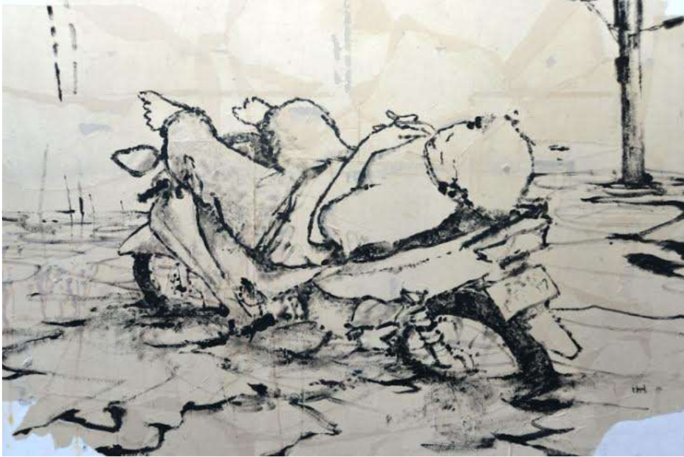
Tác phẩm “Xe ôm” của tác giả Nguyễn Minh Thi Nguyễn thể hiện trên chất liệu Màu Acrylic trên giấy gió. Tác phẩm thể hiện một người xe ôm vẫn bình thản ngủ mặc dù xung quanh ngập lụt như là chuyện hết sức bình thường.