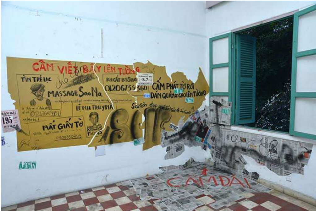
Tác phẩm “Cắm 080888” của tác giả Trần Quốc Giang với nội dung phản ánh về tình trạng dán các tờ quảng cáo vô tội vạ trên tường khiến cho nhiều góc phố ở Sài Gòn trở nên nhem nhuốc, bẩn thỉu.