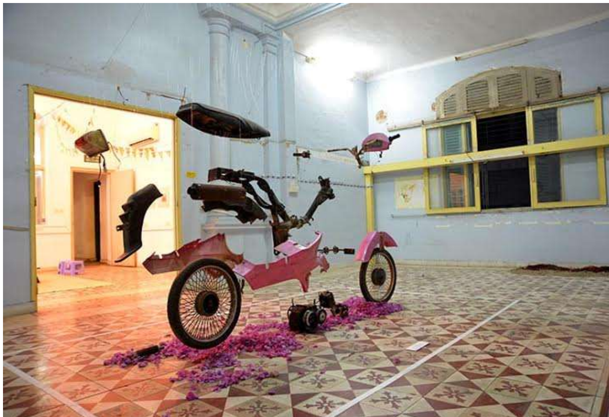
Tác phẩm “ Xe Hông da Kawasaki – Honda” Chất liệu: Kawasaki – Honda, dây cước, hoa giấy của tác giả Pierre Larauza.

Đây là giai đoạn đầu tiên của dự án La Centrifugeuse/ Máy xay sinh tố, một dự án nghệ thuật về chủ đề lai trộn văn hóa và biến đổi đô thị.